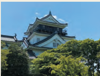
武將と行く! 城めぐり珍道中 徳川家康生誕～岡崎城～

愛知県の中部、西三河エリアの魅力たっぷりの番組を特集でお届け。地域の歴史やグルメを通じて感じる、日本の伝統と文化の豊かさを、ぜひお楽しみください。よる7:00は愛知県西尾市で行われる「鳥羽の火祭り」を生中継。