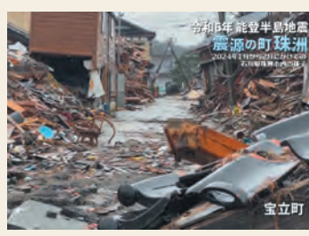
令和6年能登半島地震震源の町 珠洲 復旧・復興へと向かう 2024年1月から2月にかけての珠洲市内の様子

未曾有の大災害を引き起こした「令和6年能登半島地震」。番組『令和6年能登半島地震 震源の町 珠洲』では、震源の町となった石川県珠洲市の震災以前の映像をおりまぜながら、復旧復興への想いを届けます。