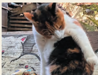
尾道ねこ探訪

猫の魅力がたっぷりと伝わる番組をお送りします! 『尾道ねこ探訪』では、猫の細道と呼ばれる広島県尾道市の千光寺山の南斜面地に集まる猫たちを撮影&周辺の猫スポットをご案内。他、保護猫カフェを併設した動物保護施設のスタッフを追ったドキュメンタリー番組などをお届けします。