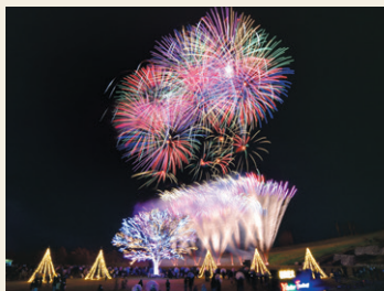
長岡花火ウインターファンタジーFinal

『【特集】日本の四季 ~冬~』では、冬の祭りの賑わい、雪景色の美しさなどを通じて、日本の冬の魅力をお送ります。『長岡花火ウインターファンタジー』は今回が最後の開催となり、8年分の「ありがとう」を込めて冬の夜空を彩ります。